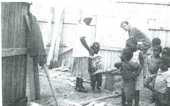
• Wiebe is bezig zijn eigen huis te bouwen in de sloppenwijk, Mama Ganeko en de kinderen kijken toe.

Tijdens mijn verblijf op het medisch schip de Anastasis ontmoette ik een Zuid-Afrikaanse blanke jonge man. Joop (dit is niet zijn echte naam) woonde in een sloppenwijk met als doel evangelisatiewerk te doen onder de inwoners die allen Xhosa's zijn. Voordat ik eind februari 1997 het schip moest verlaten om mijn werk in Oostenrijk te hervatten, hadden Joop en ik plannen gemaakt, zodat ik terug kon komen om hem te helpen met het evangelisatiewerk. Terug in Oostenrijk begon ik direct met de aanvraag van een verblijfsvergunning voor Zuid-Afrika die ik in juni ontving. Hierna stuurde ik een brief naar Joop met het bericht dat mijn aanvraag was goedgekeurd en dat ik zo spoedig mogelijk zou komen. Eveneens nam ik ontslag en reisde naar Nederland om afscheid te nemen van mijn familie en bekenden. In Nederland boekte ik de reis naar Zuid-Afrika. Toen werd ik gebeld door Joop. Hij vertelde me dat hij niet meer in de wijk woonde, omdat het werk hem te zwaar was geworden. Hij was teruggegaan naar zijn ouderlijk huis (1000 km bij de sloppenwijk vandaan). Mijn hele wereld leek in te storten. Wat moest ik nu doen? Een